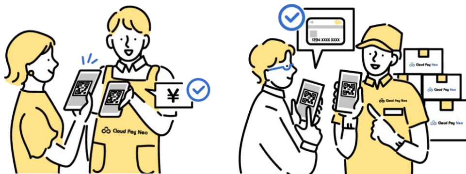
「CloudPay Neo」業種別決済ソリューション第1弾「ダイナミックQRコード生成機能」ご利用イメージ